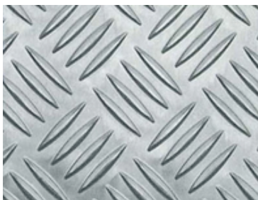
アルミ縞板山形凹凸表面形態